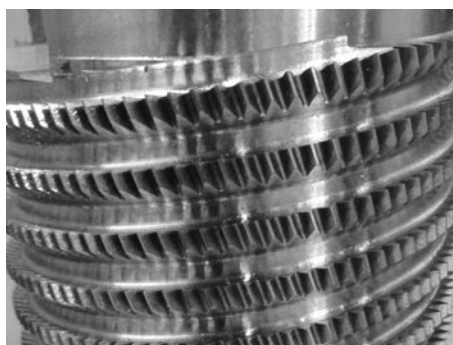
Werkstück mit verdrehter Spannutt