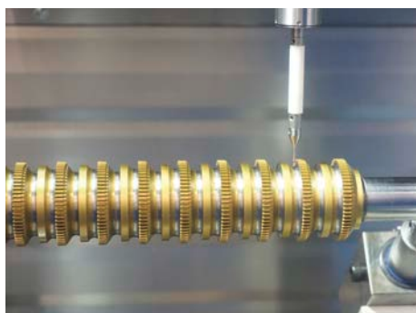
Vermessen des Werkstückes